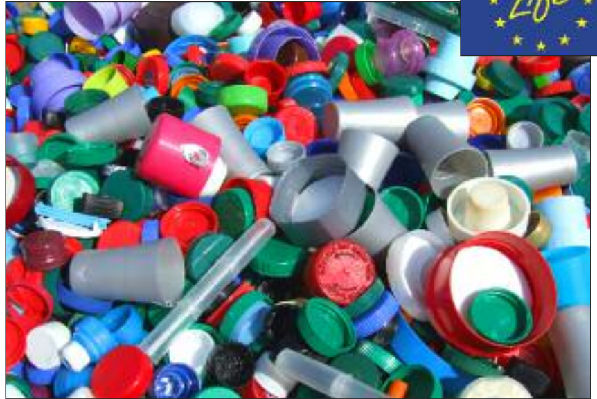
La mayor parte de los centros han elegido el tratamiento de residuos como tema principal.

Ser parte de esta Red supone, por parte de los centros, el cumplimiento de unos objetivos medioambientales basados en la Agenda 21 local, que indica las pautas a seguir para conseguir el objetivo principal: lograr un equilibrio sostenible que, en definitiva, redunde en una mejora de la calidad de vida. Los participantes tienen tres temas a elegir: agua, residuos o energía. Una vez seleccionado, deben realizar acciones medioambientales desde el punto de vista educativo. La mayoría han elegido el tratamiento de residuos como tema. Además, deben cumplir objetivos en el propio centro como la reducción del consumo de agua, residuos y energía, transformándose así en un entorno ejemplarizante donde a los alumnos les resulta más fácil