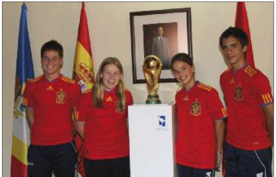
Jóvenes futbolistas junto a la Copa el día del Pregón de San Miguel.

Inicialmente se había anunciado su exposición a finales de enero, pero hubo de posponerse porque el trofeo debía viajar a Zurich para tallarle la leyenda España campeona del Mundo Sudáfrica 2010 , que quedará grabada para siempre en recuerdo de la hazaña que protagonizó nuestra selección el pasado 11 de julio de 2010. La Copa del Mundo de Fútbol