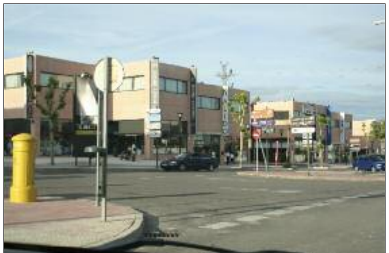
Una de las calles principales de Európolis.

El Ayuntamiento de Las Rozas, con el ánimo de lograr una mejor gestión de los residuos producidos en el Polígono Európolis, confeccionó en el primer trimestre del 2009, un cuestionario que alrededor del 50% de las empresas formalizaron, mediante el cual se pudo constatar que la mayor parte de los residuos generados en la zona se refiere al papel cartón, madera ( palés ) y plástico de embalaje. Entre las medidas que el Ayuntamiento tomará en colaboración con la E.U.C.C. Európolis para facilitar el reciclaje de residuos generados en el Polígono y en especial el cartonaje, destaca la puesta en marcha del sistema de recogida Puerta a Puerta para aquellas empresas que por circunstancias especiales no puedan depositarlos en los puntos de reciclaje, la retirada paulatina de los contenedores metálicos de Recogida Lateral existentes en el Polígono dejando sólo aquellos para las actividades que generan materia orgánica (supermercados, cafeterías, restaurantes etc.) y la colocación de contenedores de Carga Trasera para el depósito de la materia orgánica (basura) que cada empresa pueda generar.