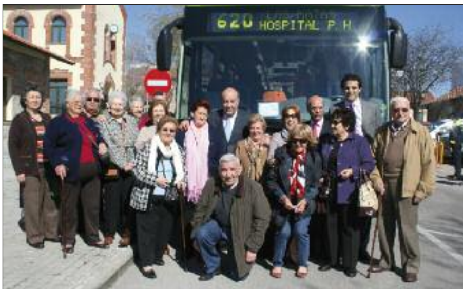
El Alcalde y varios concejales junto a representantes del Club Social de Mayores junto al autobús de la nueva línea.

E n pleno barrio ferroviario de Las Matas tuvo lugar la presentación de la nueva línea de autobús que une Las Matas con el Hospital Puerta de Hierro. A la presentación acudieron el Alcalde de Las Rozas, el Concejala de Movilidad, Transportes y Comunicaciones, así como otros miembros del equipo de gobierno, representantes de Auto-periferia y miembros de la Junta de Mayores. Esta nueva línea de autobús, la 620, era un compromiso tanto de la Comunidad de Madrid como del Ayuntamiento en sustitución del proyecto de metro ligero. A la hora de trazar su recorrido se ha tenido en cuenta que vertebrase el municipio y que, además de conectar el barrio de Las Matas, recorra buena parte del resto de Las Rozas y facilite la comunicación con el hospital de referencia para el municipio, el Hospital Puerta de Hierro.