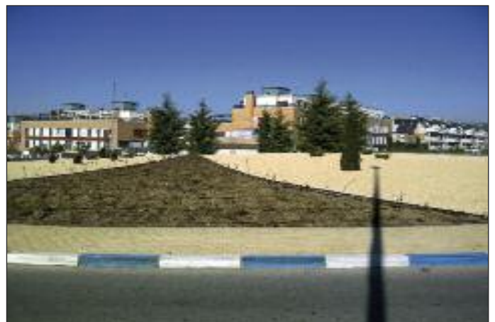
Rotonda con xerojardinería en El Cantizal.

Mediana de la Avenida de Esparta, Rotonda de la Plaza Víctimas del Terrorismo, Mediana de la Avenida de Esparta, Rotonda de la Calle Aristóteles-Calle Sófocles, Rotonda de la Calle Aristóteles-Avenida de Atenas, Rotonda de la Avenida de Lazarejo-Calle Kálamos y los paños exteriores de la Avenida de Lazarejo-Calle Jaras.