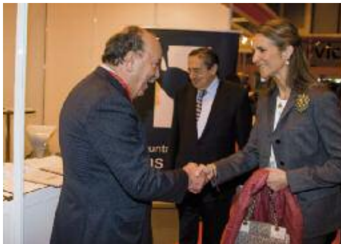
El Alcalde de Las Rozas saluda a la Infanta Elena en la inauguración de la Feria.

donde se recogieron más de 3.500 currículos de los demandantes de empleo, que se harán llegar a las empresas roceñas consignadas por los candidatos.