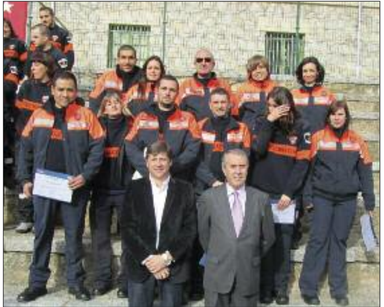
Los nuevos graduados junto al Jefe de Policía Local y el Director General de Protección Ciudadana de la Comunidad de Madrid.

El curso de formación básica para aspirantes a voluntarios comprendía numerosas materias, unas teóricas y otras de índole práctica. Entre ellas figura transmisiones, socorrismo, prevención y protección contra incendios, normas básicas de protección civil, riesgos naturales, autoprotección, intervención de grupos de acción (con tiendas, helicópteros y vehículos contra incendios y sanitarios) e intervenciones psicosociales en emergencias. Los nuevos voluntarios componen la 12ª promoción de estos profesionales que de forma altruista dedican su tiempo libre a los demás.