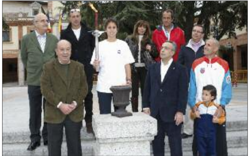
El Presidente del COE y el Alcalde de Las Rozas junto a varios concejales y deportistas, en el momento del encendido de la antorcha a cargo de la primera relevista.

El objetivo de la celebración de estos Juegos es impulsar la importancia del esfuerzo, la capacidad de superación, el trabajo en equipo y el juego limpio. Las Olimpiadas están organizadas por las