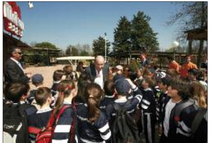
El Alcalde de Las Rozas saluda a los escolares congregados en el Zoo-Aquarium.

De una manera lúdica, se trató de sensibilizar a los alumnos sobre los problemas ambientales y se propusieron con ellos soluciones, como el desarrollo de conductas cotidianas que impliquen el respeto y la protección de los espacios naturales y minimicen el impacto de nuestras acciones sobre el medio natural. Los monitores trabajaron potenciando la participación en actividades enfocadas a la resolución de problemas medioambientales como la erosión, la desertización, la salinización, la sequía y el cambio climático. Estos conocimientos han quedado registrados en un cuaderno que los alumnos realizaron junto a sus monitores. Tras la exhibición de delfines, el Alcalde saludó a