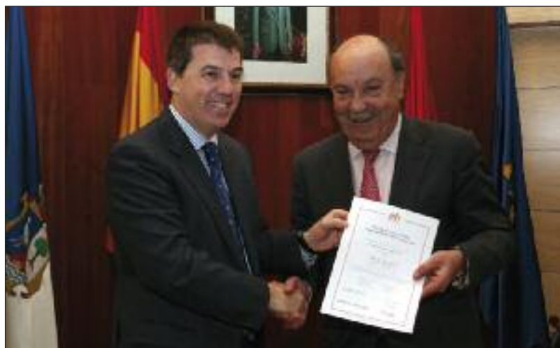
El Alcalde de Las Rozas y el Director General de la Fundación MásFamilia tras la entrega del certificado efr municipio.

En el acto se hizo entrega al Ayuntamiento de Las Rozas el certificado efr municipio por su compromiso con la conciliación, igualdad y responsabilidad familiar, que solo poseen otros seis municipios en toda España. También se presentó la Guía Municipal de Servicios para la Conciliación, un catálogo de medidas y recursos diseñados por el Ayuntamiento de Las Rozas orientados al bienestar y la calidad de vida de la población roceña. El certificado lo entregó el Director General de la Fundación MásFamilia, quien comentó que “gracias a la familia española se puede mantener sin mayor conflictividad social la tasa de paro que soportamos”.