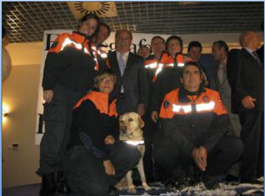
Los integrantes de la Unidad Canina, junto al Alcalde de Las Rozas tras recibir el premio.