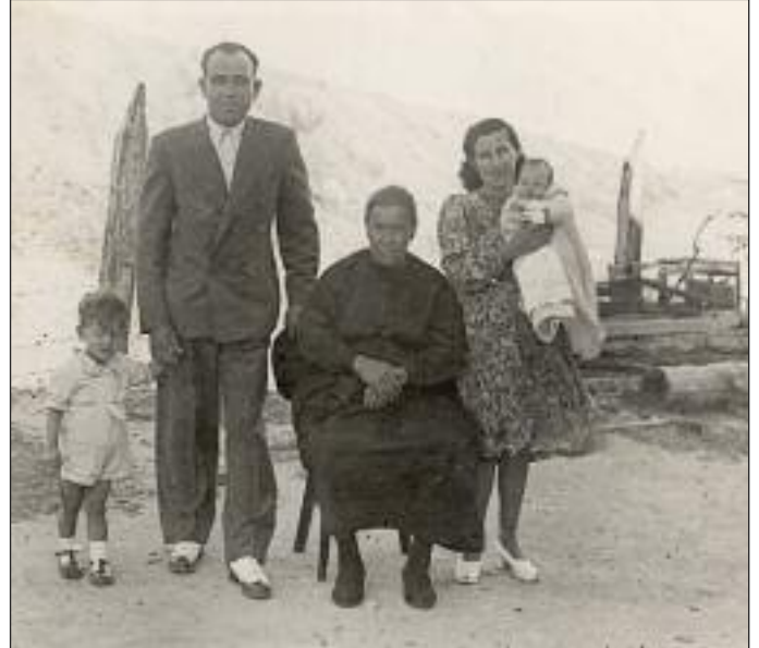
Este retrato, donado por la familia de la Cueva, formaba parte de la muestra.

Con esta exposición se da el primer paso para la creación de un gran archivo de imágenes sobre el municipio para cuya formación se solicitará próximamente la colaboración a todos los vecinos para que aporten cuantas fotografías deseen. Una vez recibidas y clasificadas pasarán a formar parte de un archivo visual que el Ayuntamiento roceño protegerá y difundirá convenientemente.